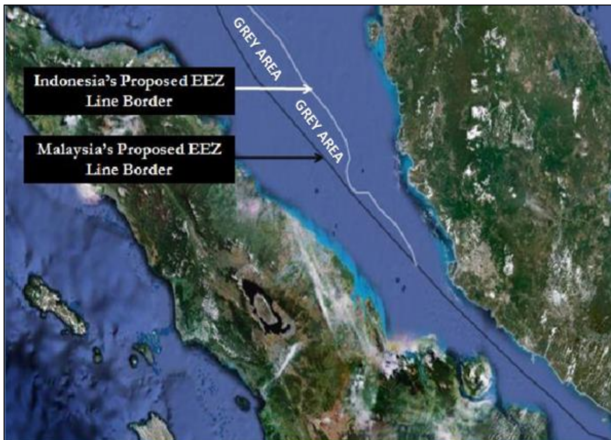
Peta 3. Zon Pertikaian EEZ di antara Malaysia dan Singapura di Selat Melaka

Setakat ini, belum wujud perjanjian di antara Malaysia dan Indonesia berkenaan perbatasan EEZ di sebelah utara Selat Melaka. Malaysia menginginkan garis perbatasan pelantar benua diaplikasikan untuk perbatasan EEZ manakala Indonesia tidak mahukan garis yang sama diguna pakai (Angkasari et al. , 2020). Oleh kerana itu, perbincangan masih dilakukan terkait perkara ini mengenai perbatasan tetap EEZ di antara Malaysia dan Indonesia di Selat Melaka.