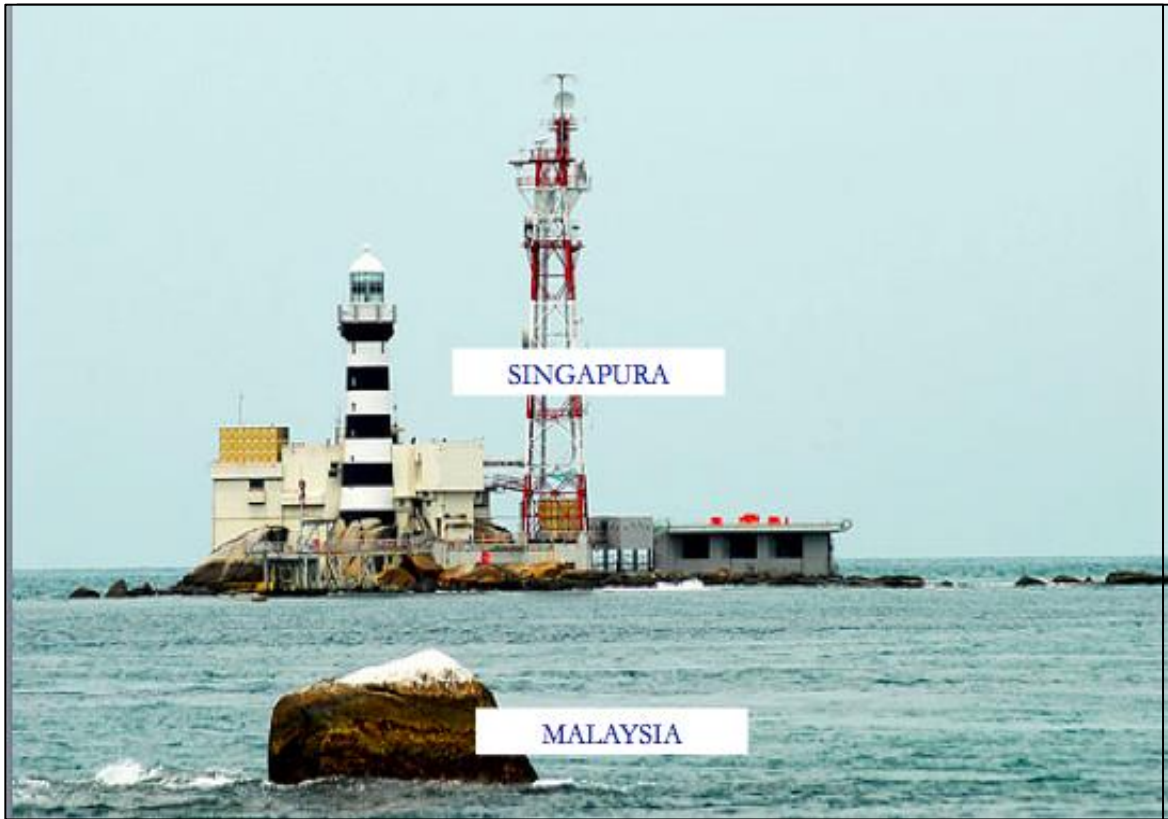
Figura 1. Jarak di antara Malaysia dan Singapura di kawasan Batu Puteh (Rusli, M. H. M., 2014)

Jarak di antara Batuan Tengah dan Batu Puteh adalah lebih kurang 1 kilometer dari satu sama lain. Oleh kerana sesebuah negara boleh menuntut wilayah laut seluas 12 nautika batu, sudah pasti tuntutan wilayah di antara Malaysia dan Singapura boleh bertindih di kawasan ini.