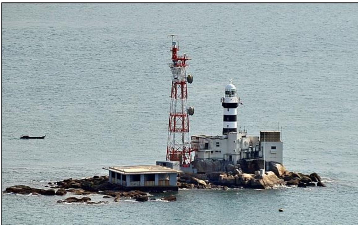
Figura 2. Batu Puteh dari Udara

Tidak seperti Langkawi, Tioman mahupun Payar, Batu Puteh (seperti yang digambarkan dalam Figura 3) dengan sendirinya hanyalah sekadar batuan yang mana tidak ada pohon boleh tumbuh di atasnya secara semula jadi. Tanpa Rumah Api Horsburgh yang dibina oleh British, Batu Puteh tidak layak didiami oleh manusia. Artikel 121 (3) LOSC secara jelas menerangkan bahawa batuan hanya boleh menjana wilayah perairan dan tidak boleh mempunyai EEZ atau pelantar benuanya sendiri. Dengan fakta-fakta ini, jelas bahawa Batu Puteh secara semula jadinya cuma batuan dan bukanlah sebuah pulau (Rusli, M. H. M., 2017). Oleh itu Singapura tidak boleh menuntut EEZ di Laut China Selatan.