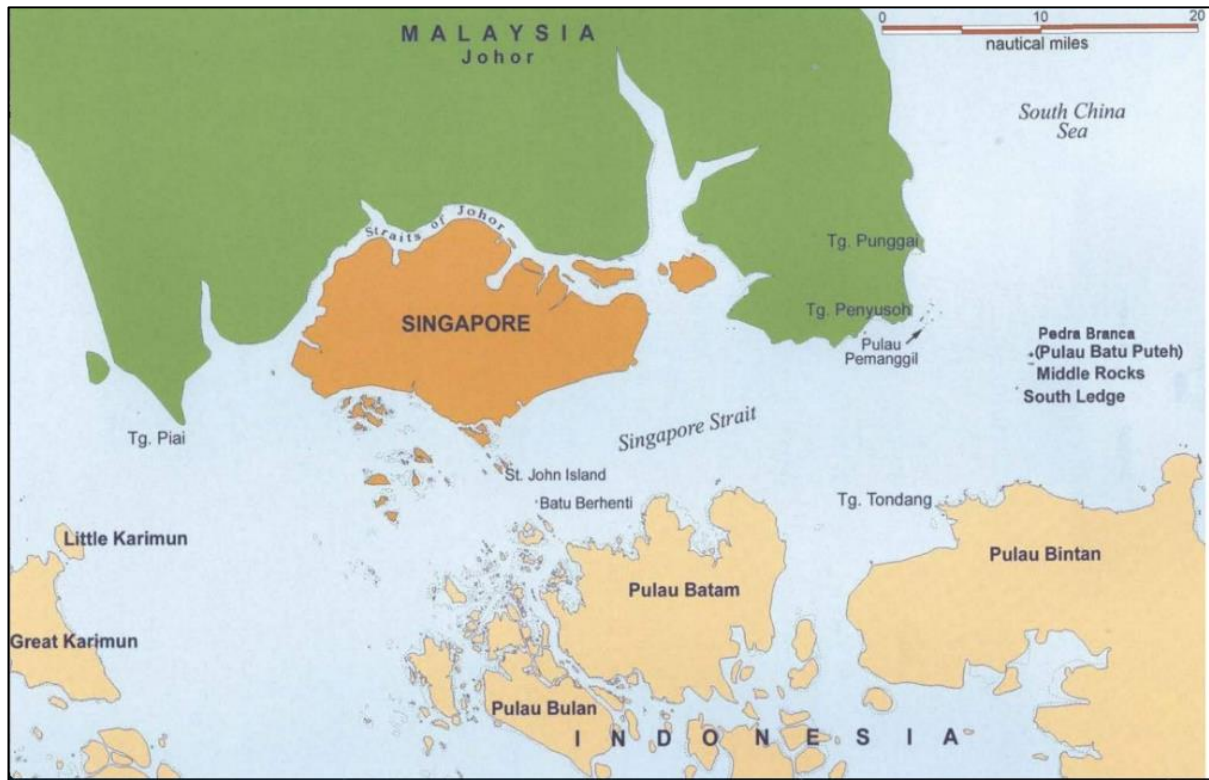
Peta 4. Lokasi Tubir Selatan ( South Ledge ) di Laut China Selatan

Setelah hampir 10 tahun kes Batu Puteh selesai, kebanyakan rakyat Malaysia mungkin telah melupakan kes ini dan kini lebih menumpukan perhatian kepada tuntutan China di Laut China Selatan (Rusli, M. H. M., 2020a). Oleh itu adalah penting untuk melihat semula implikasi keputusan ICJ ini terhadap senario perbatasan dan tuntutan maritim di kawasan paling selatan di Laut China Selatan ini.