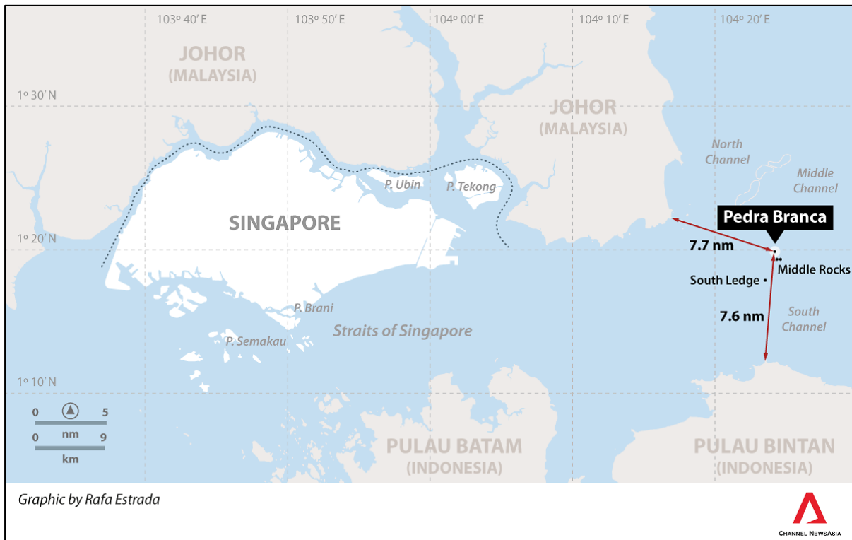
Peta 5. Kedudukan South Ledge/Tubir Selatan di Laut China Selatan

Malaysia dan Singapura telah pun menubuhkan Jawatankuasa Teknikal Bersama untuk menggariskan sempadan maritim di kawasan sekitar Batu Puteh dan Batuan Tengah serta menentukan hak kedaulatan ke atas Tubir Selatan (Zhuo, 2020).